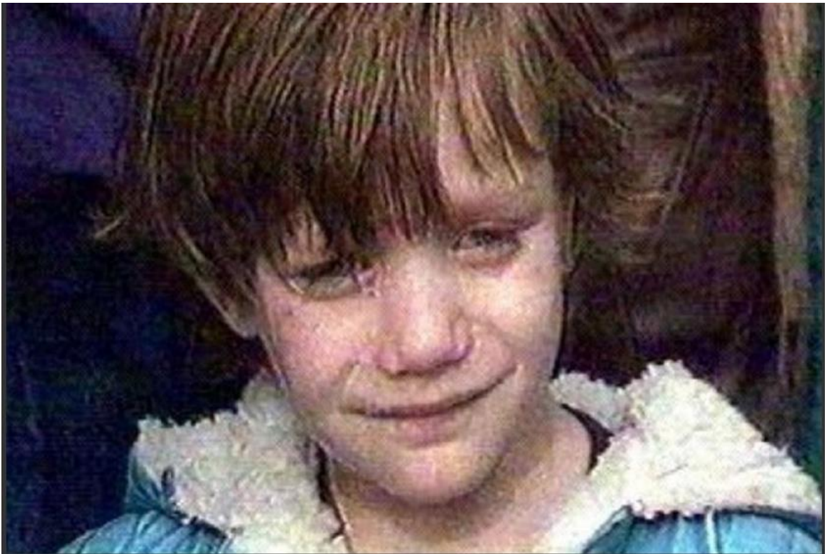
Djevojčica u plavom kaputiću – najpoznatija fotografija djeteta iz Domovinskog rata

Može doći rat poput ovog i onda se opet neki među nama moraju odreći djetinjstva. Nemojte nikad braniti djeci da uživaju u svojem djetinjstvu, ne tjerajte ih da prerano odrastu, jer što ih poslije čeka? Što – bez djetinjstva?